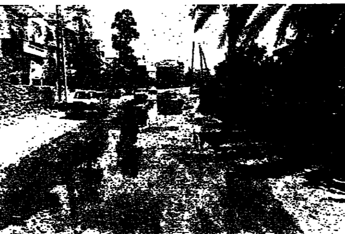
السيول تغطي الشارع المؤدي الى السرايا

صيدا - من مراسل «الانوار»: ضاقت مياه المجارين في صيدا جديدا واضطرت الشوارع الرئيسية في المدينة. وظلت المياه تغطي الشوارع دون ان تبادر اجهزة البلدية الى اتخاذ الاجراء كسب هذه المياه الى الطرقات العمية، خاصة وان البلدية تسلمت سبع ايات هدية من